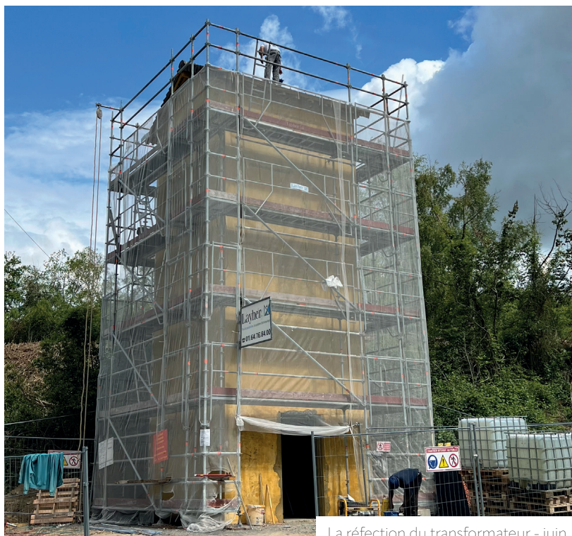
La réfection du transformateur - juin

Les travaux concernent le ravalement de la façade, la charpente, la serrurerie, la suppression des cloisons et le remplacement de la porte actuelle par une porte blindée d'une part. L'électricité, la pose d'éclairage, de panneaux solaires et d'une horloge crépusculaire d'autre part. L'installation de caméras de vidéoprotection est également prévue pour protéger l'œuvre et sécuriser l'entrée de la Voie verte.